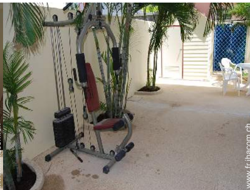
machine(s) de musculation