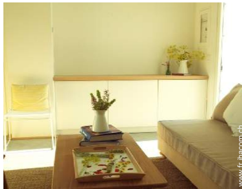
Bungalow de Prestige