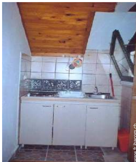
ustensiles et batterie de cuisine