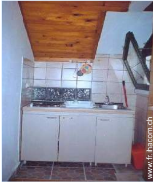
ustensiles et batterie de cuisine