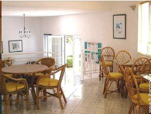
Agencement intérieur à disposition des hôtes