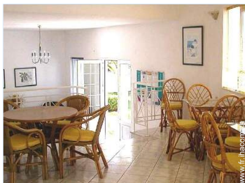
Agencement intérieur à disposition des hôtes