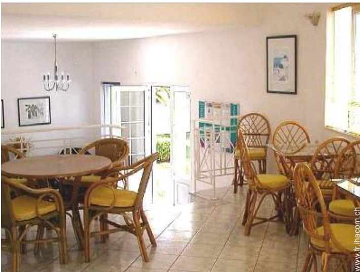
Agencement intérieur à disposition des hôtes