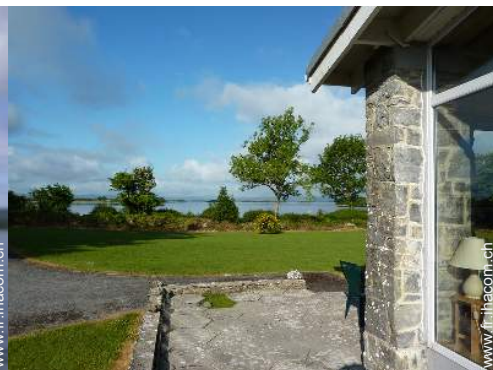
vue depuis la véranda