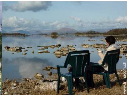
vue sur lac