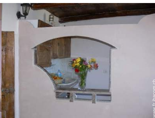
grande cuisine américaine