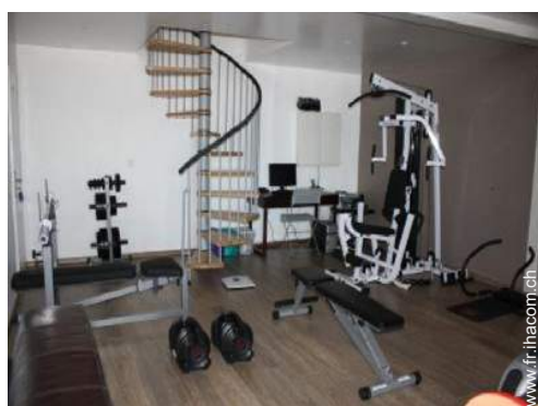
machine(s) de musculation