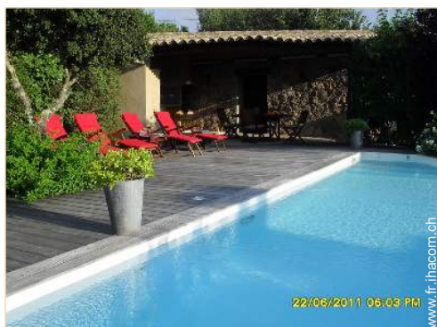
Piscine à débordement