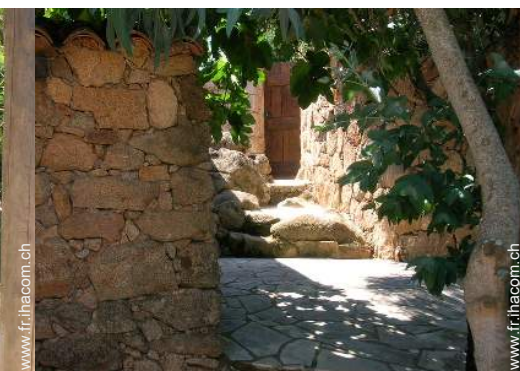
Maison de Charme en Pierre