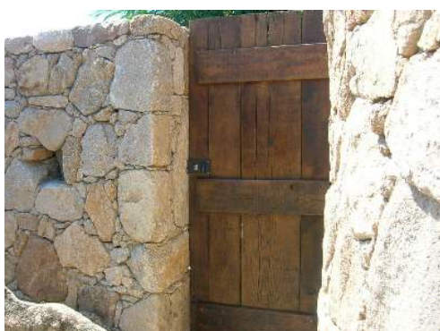
Propriété de Prestige