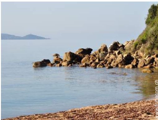
plage de rocher