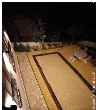
terrain de pétanque