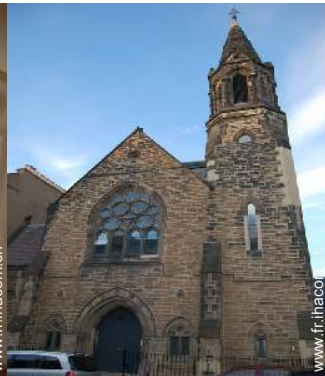
Ancienne Chapelle de Charme