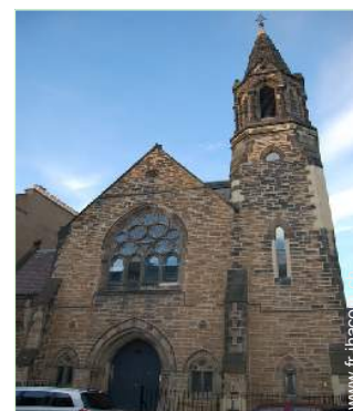
Ancienne Chapelle de Charme