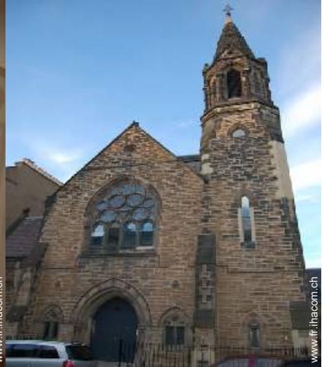
Ancienne Chapelle de Charme