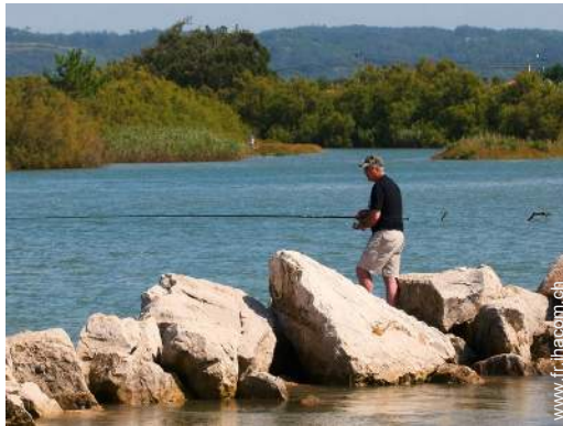
pêche à la ligne