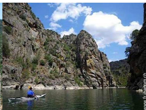
bateau avec rames