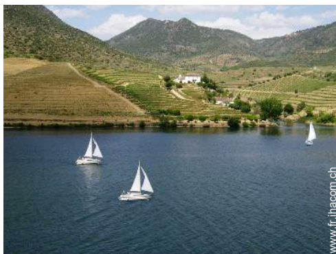
location de bateau