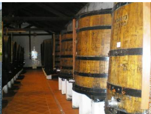
cave et dégustation de vin