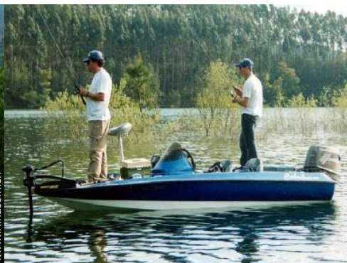
pêche à la ligne