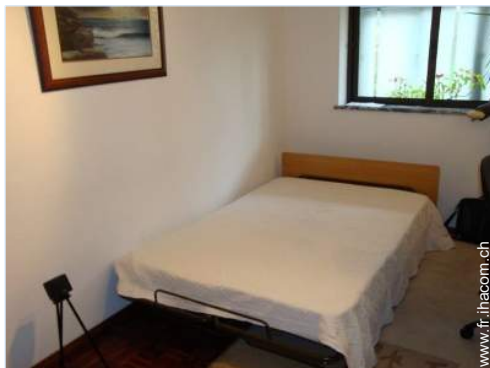
lit(s) escamotable(s) 2 pers