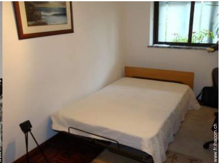
lit(s) escamotable(s) 2 pers