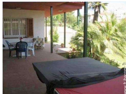
chaise(s) de jardin