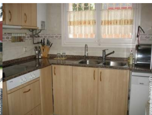
plaques de cuisson