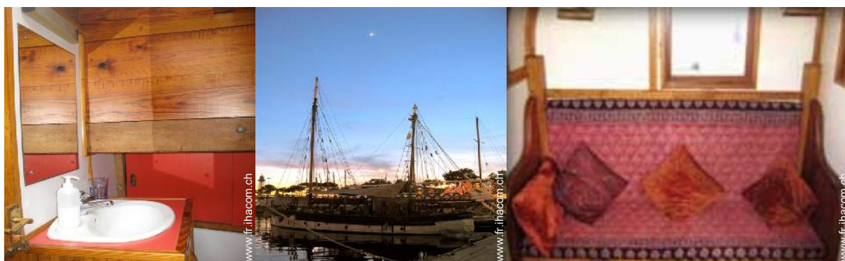
Agencement intérieur à disposition des hôtes