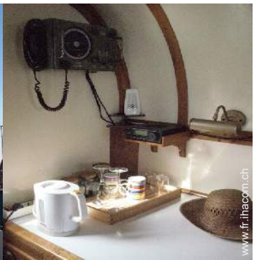
Confort intérieur à disposition des hôtes