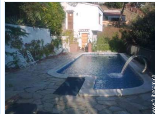
Piscine d'eau de mer