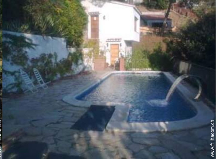
Piscine d'eau de mer