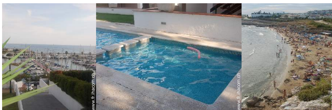
vue sur port