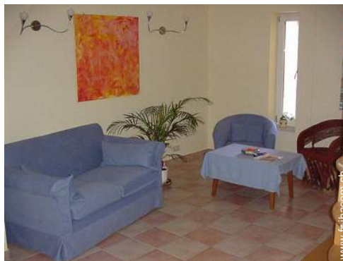
collection de livres