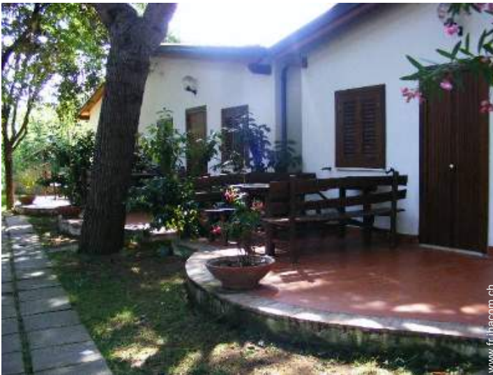
Maison de Village