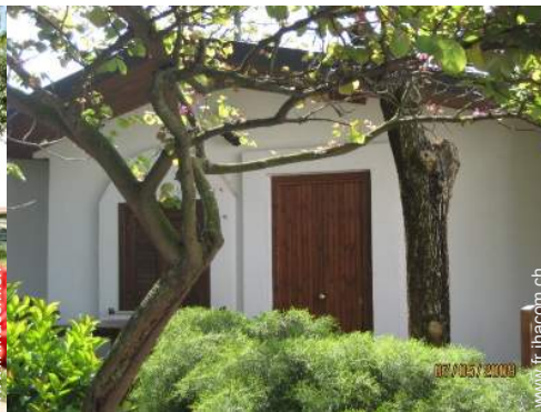
Maison de Village