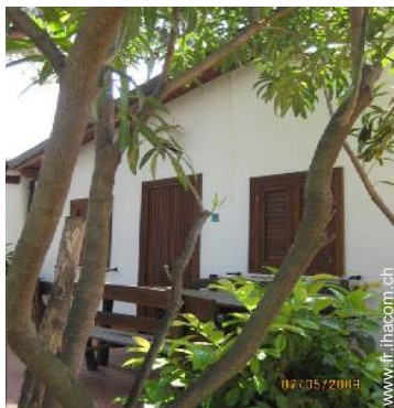
Maison de Village