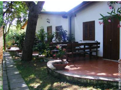
Maison de Village