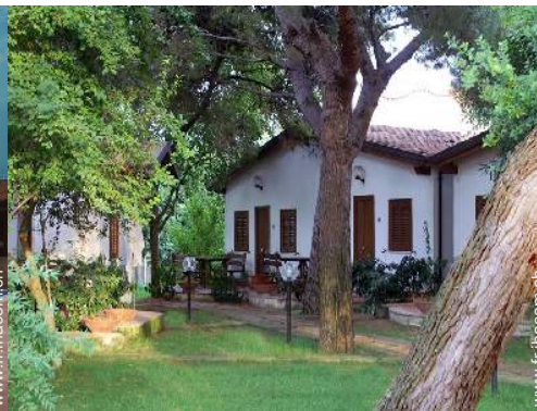
Maison de Village