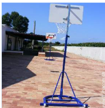
panier de basket