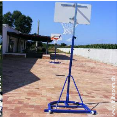
panier de basket