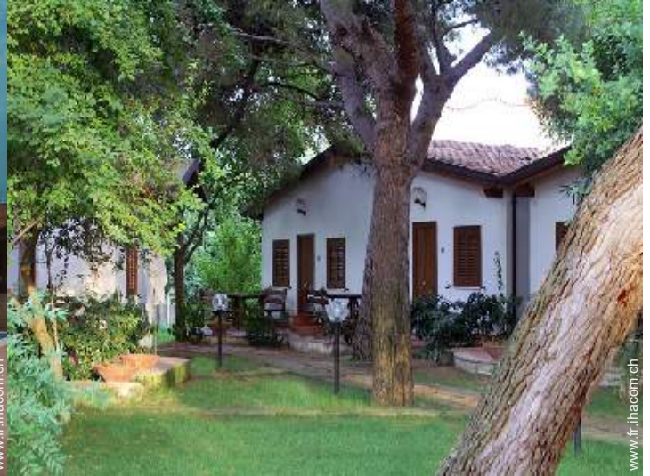
Maison de Village