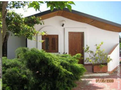
Maison de Village