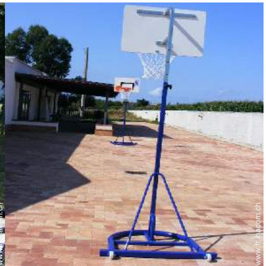
panier de basket