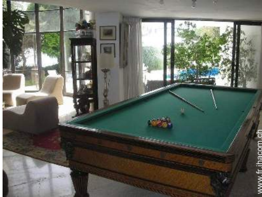
salle de jeux