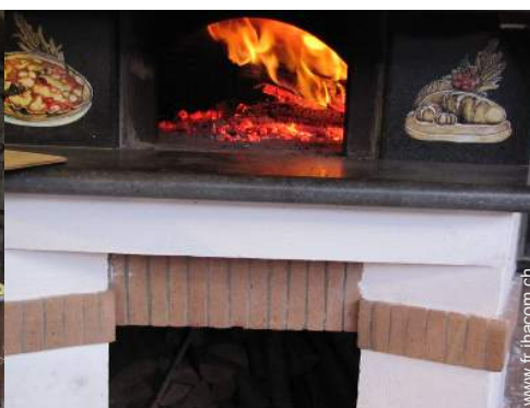
four à pizza