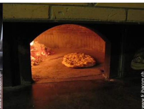
préparation repas local