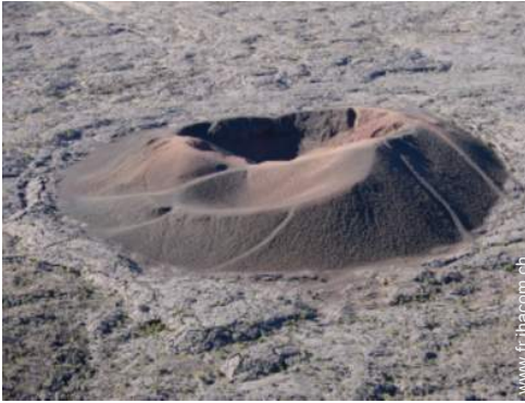
loisirs de montagne à proximité