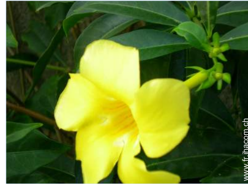
parc et jardin