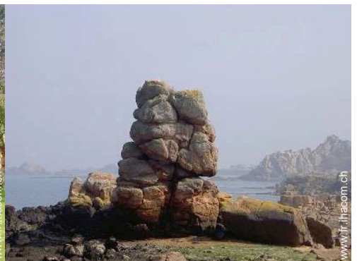
Attraites et détente