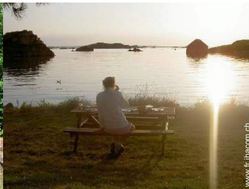
Attrait et détente