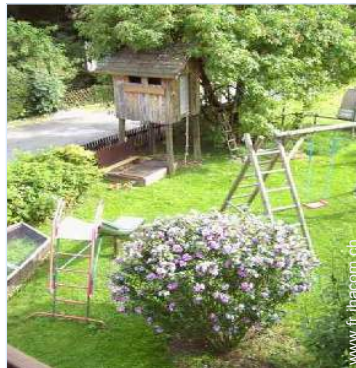
bac à sable