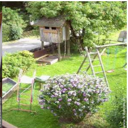
bac à sable