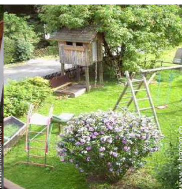
bac à sable