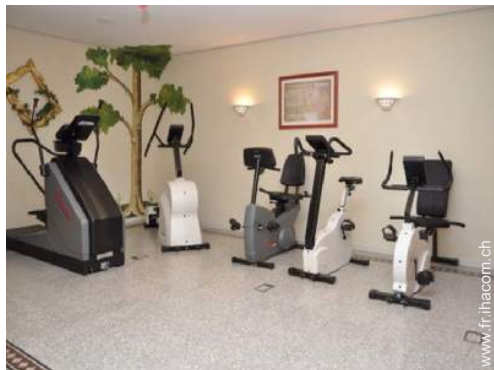
machine(s) de musculation