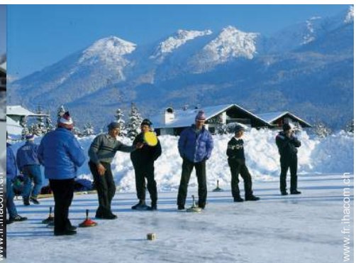
loisirs d'hiver à proximité