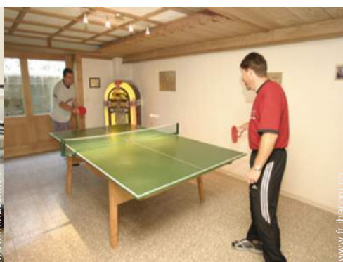
table de ping-pong