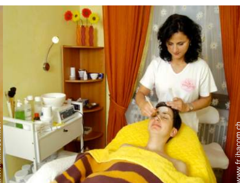
soin de beauté