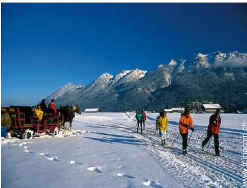
loisirs d'hiver à proximité