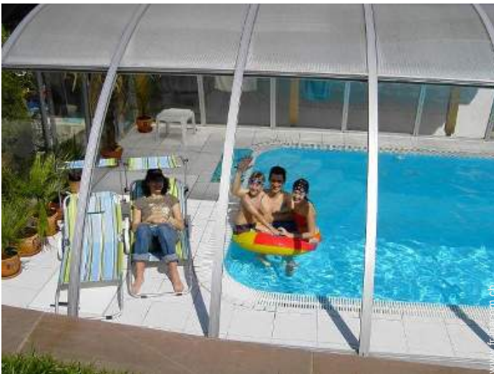
Piscine d'eau de mer