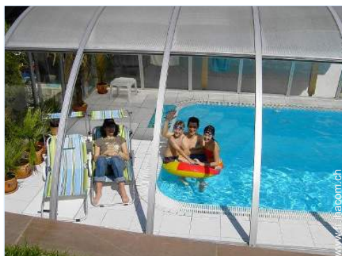
Piscine d'eau de mer