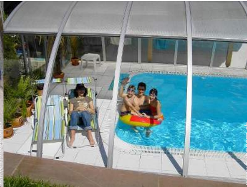
Piscine d'eau de mer