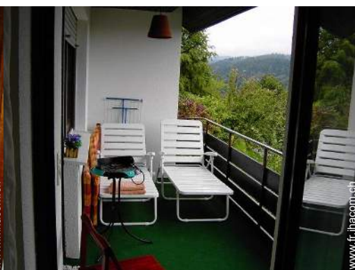
vue depuis la loggia