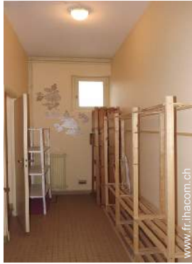
local à ski