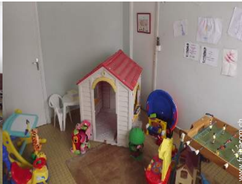
salle de jeux