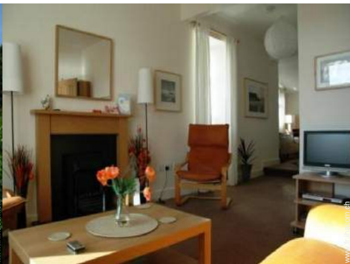
Cottage de Charme