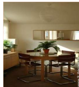
Cottage de Charme