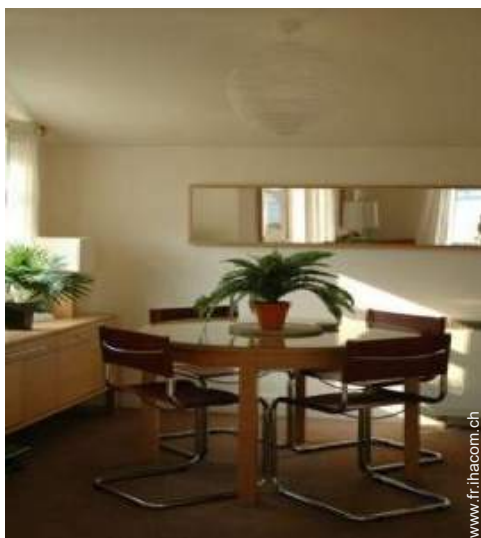
Cottage de Charme