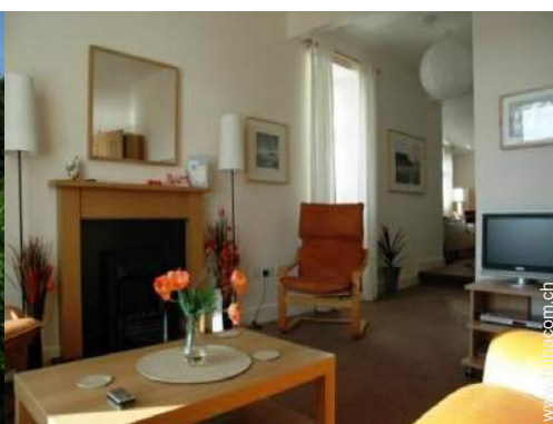
Cottage de Charme