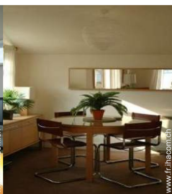
Cottage de Charme