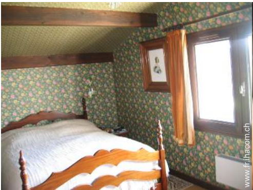
chambre du propriétaire