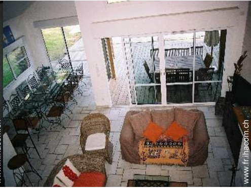
vue depuis la mezzanine