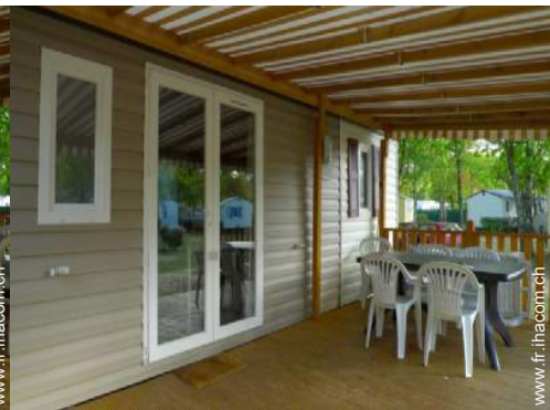
chaise(s) de jardin