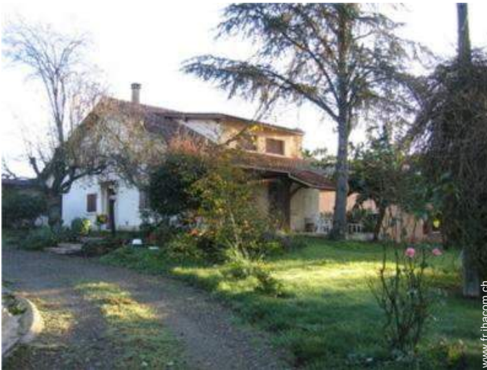
Maison de Campagne