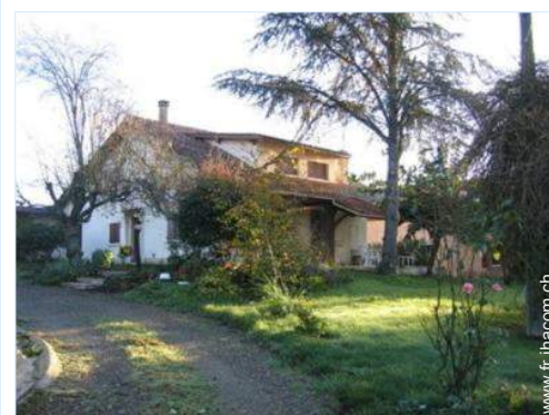
Maison de Campagne