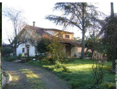
Maison de Campagne