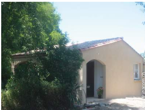
Maison de Charme