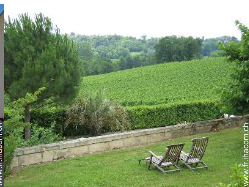
vue sur vignobles