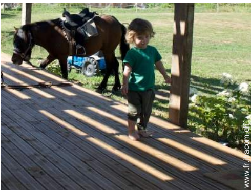
matériel équestre et chevaux