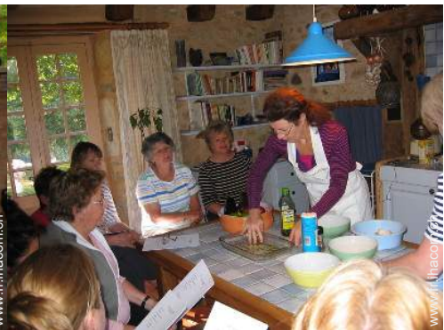
grande cuisine indépendante