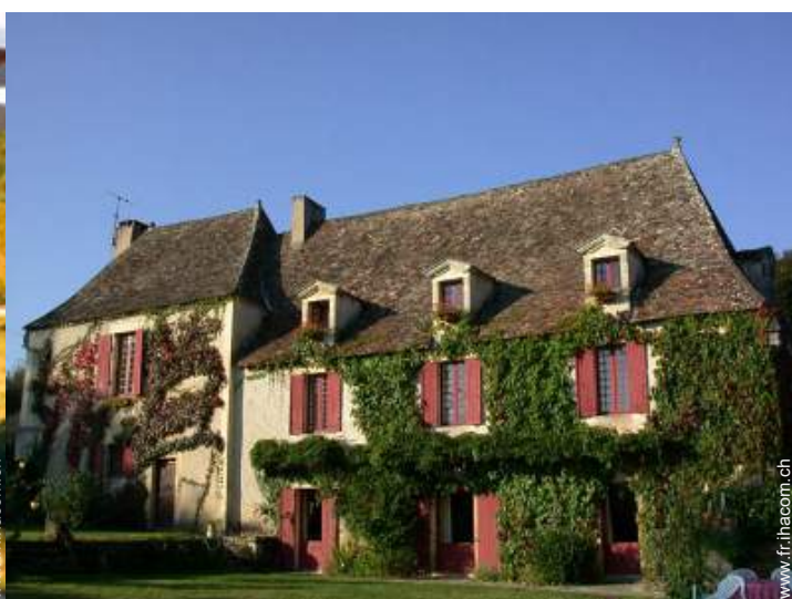
Bastide de Charme