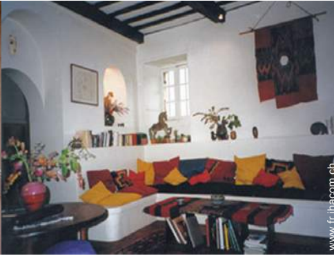
salon de musique