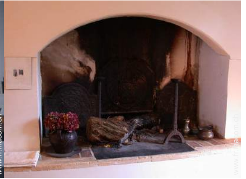
salon de musique