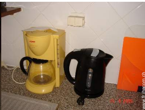
machine à café électrique