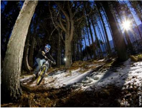
VTT (itinéraire circuit)