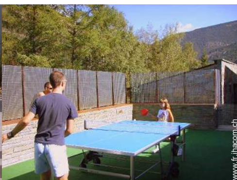
table de ping-pong