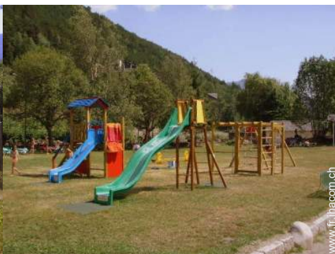
bac à sable