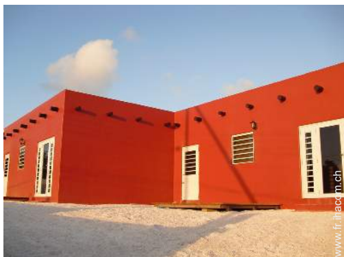
Appartement de Prestige