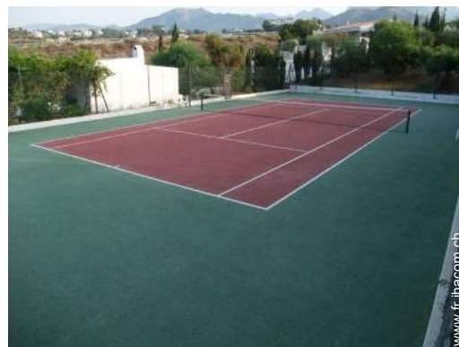
Tennis - surface synthétique