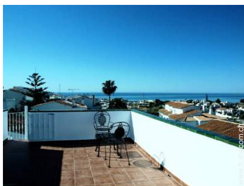
vue sur les toits