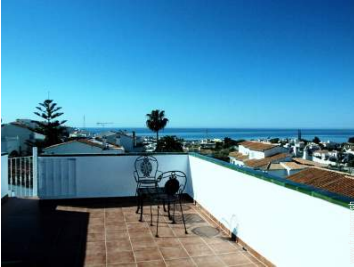
vue sur les toits