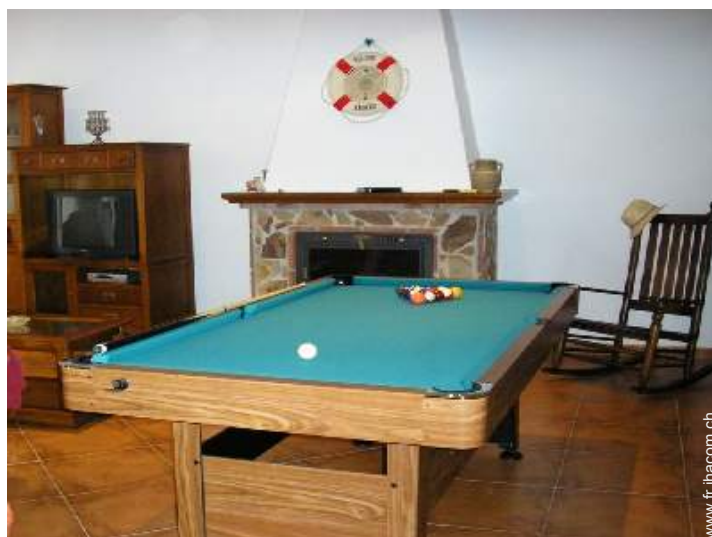
table de billard