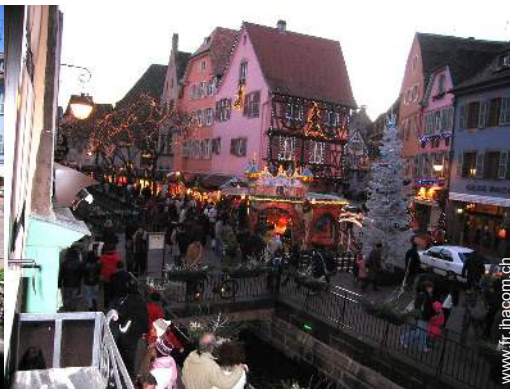
vue sur la place