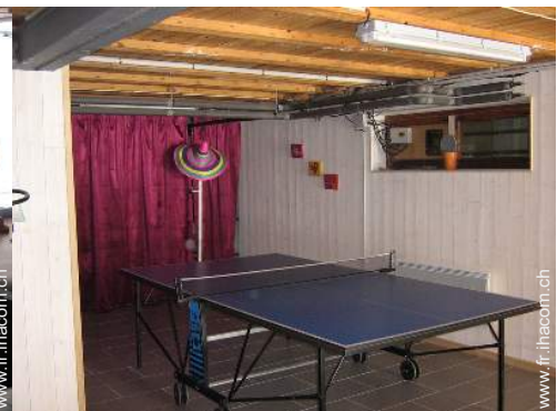
salle de jeux