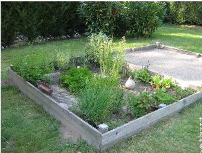
bac à sable