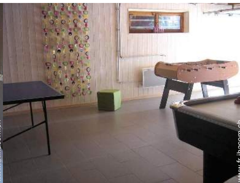
salle de jeux