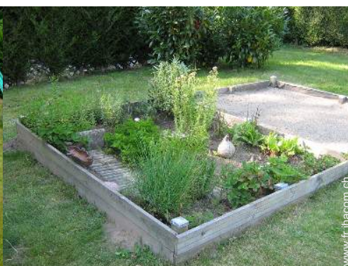
bac à sable