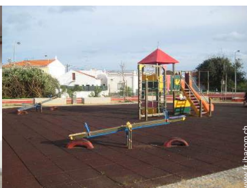
parc de loisirs