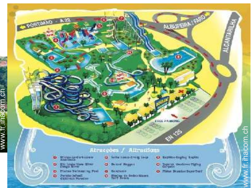
parc de loisirs