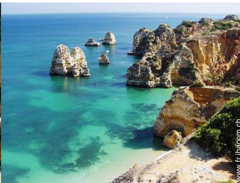
plage de naturisme