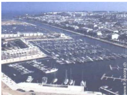
port de plaisance