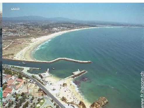
port de plaisance