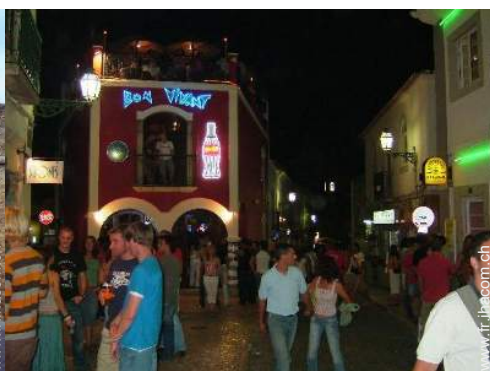
Attraits et détente