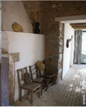
Ancienne Ferme de Charme