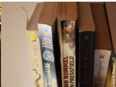
collection de livres