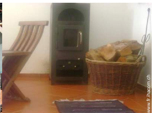
poêle à bois